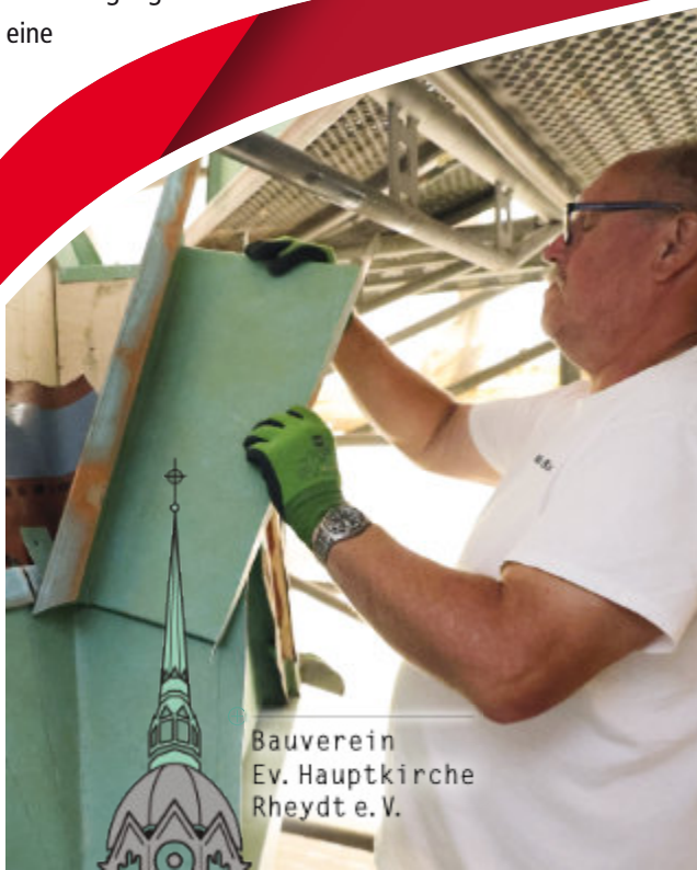
Bauverein Ev. Hauptkirche Rheydt e.V.

Am 10. November traf die förmliche Zusage einer nicht rückzahlbaren Förderung von rund 1,1 Mio. € ein. Damit kann auch das letzte und größte Teilprojekt der Sanierung der Nordseite der Hauptkirche umgesetzt werden.